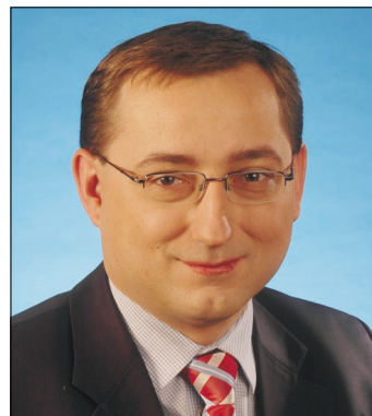
Mgr. Rudolf Blažek 1. náměstek primátora hl. m. Prahy